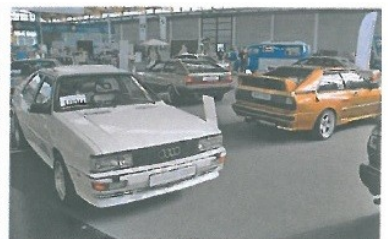
Großzügige Hallenaufteilung. Ein guter Durchblick, klare Gliederung. Schöne Exponate + „witzige Zentrale.“ IG-Quattros und Coupés unter sich.